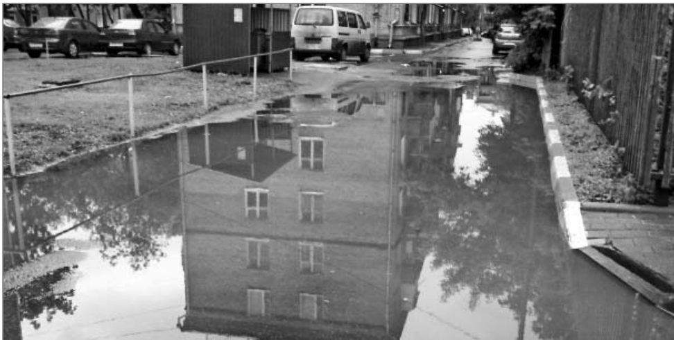
Въезд на дворовую территорию на ул. 5-я Парковая, напротив здания управы района