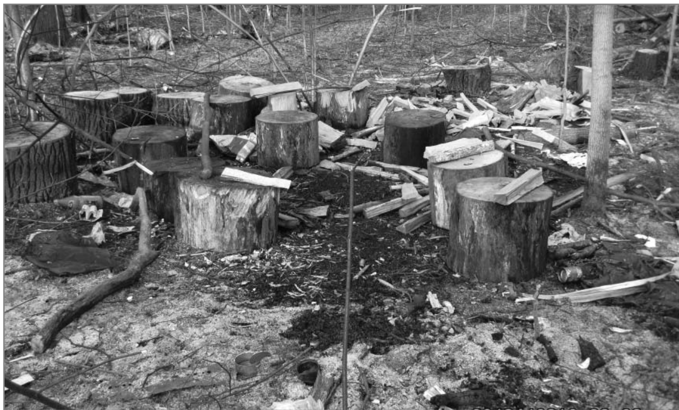
3. Невывезенные порубочные остатки также используются для стихийных пикниковых точек