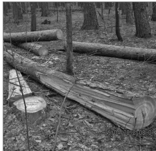
1. Отсутствует клеймо на срубленных деревьях в заповедном лиственничнике