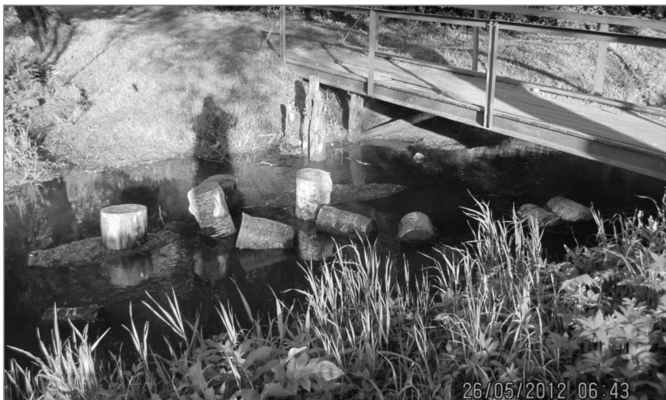
4. Порубочные остатки не вывозят, а сбрасывают в реку и владающие в нее ручьи