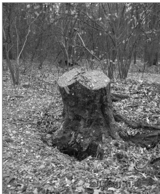
2. Высота пеньков при рубке доходит до 1 м, клеймо отсутствует